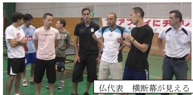
仏代表 横断幕が見える

23日(水)が、長居球技場で、F S G T招待フットアセット大会が開かれ、一般12チーム、女子3チーム参加し、これには兵庫、和歌山からも、チームが参加して行われ、大阪のH I S T O R I Aが予選リーグ、決勝と2度にわたってF S G Tを破るという快挙がありました。