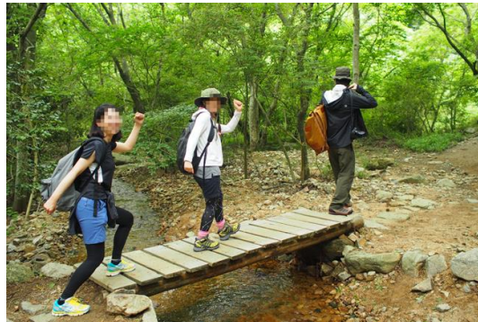
トエンティクロス